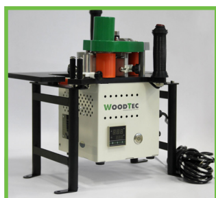
Стол для обработки малогабаритных деталей.

В комплектацию станка входит специальный стол для удобного облицовывания небольших заготовок. Монтаж/демонтаж станка со стола занимает меньше минуты.